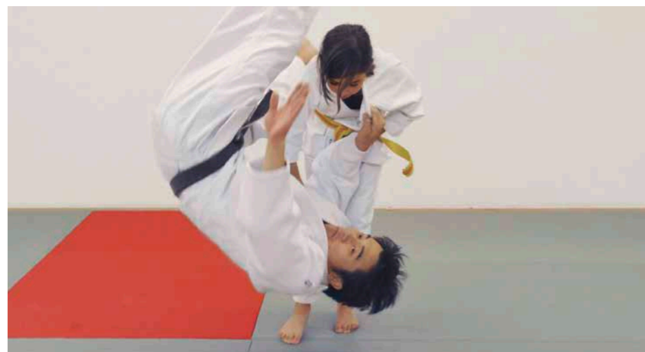
I suoi vantaggi CPT: il massimo effetto con il minimo sforzo.

Noi siamo reperibili: in qualsiasi momento e ovunque. Qualora avesse delle domande riguardo alla salute, ha accesso a un gruppo di medici. Ovviamente gratuitamente. Oppure desidera adattare la sua copertura assicurativa, consultare un conteggio delle prestazioni o stampare una distinta per la dichiarazione fiscale? Non c'è problema. La sua cartella online è disponibile in qualsiasi momento. Ovunque ne abbia bisogno: al computer, per smartphone oppure sul tablet.